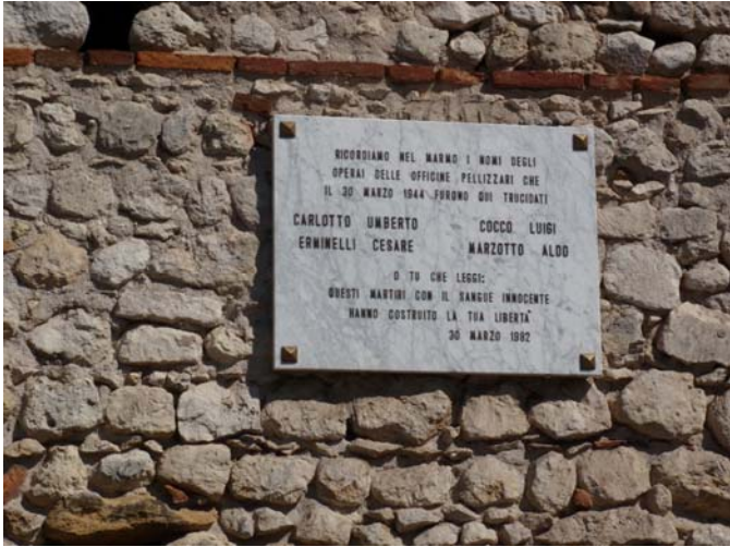
Dopo il piazzale della Chiesetta sulle mura del Castello una Targa ricordo delle vittime di Guerra.