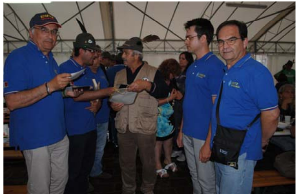
Sez. alpini Molise, Abruzzi, Alto Adige, Svizzera.