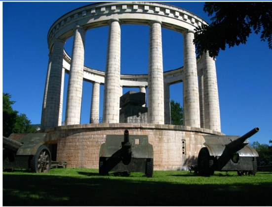
Mausoleo Cesare Battisti