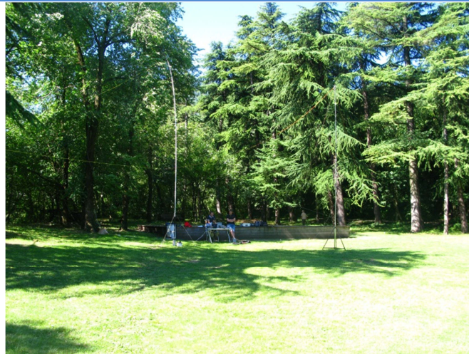
Postazione nel prato antistante il Mausoleo