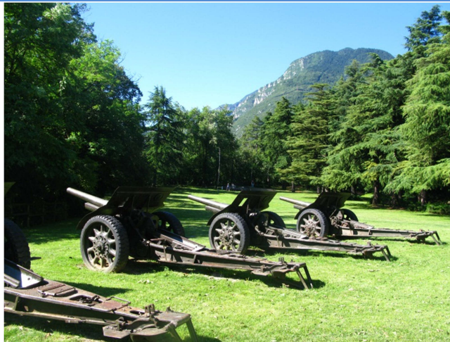
Prato di fronte al Monumento