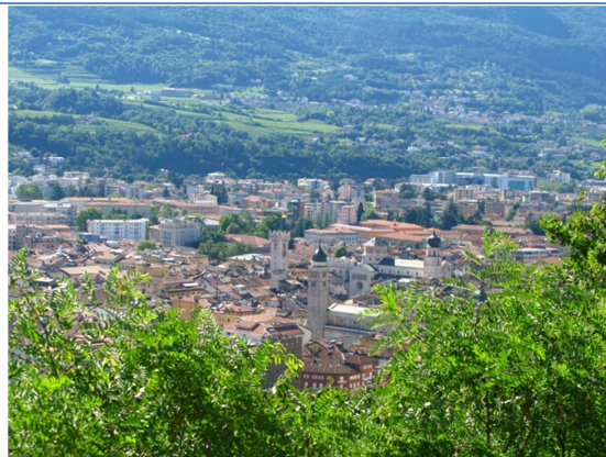
Vista di Trento