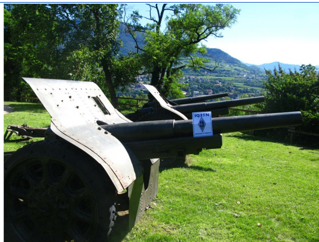
"CQ GRA DE IQ3TN..."