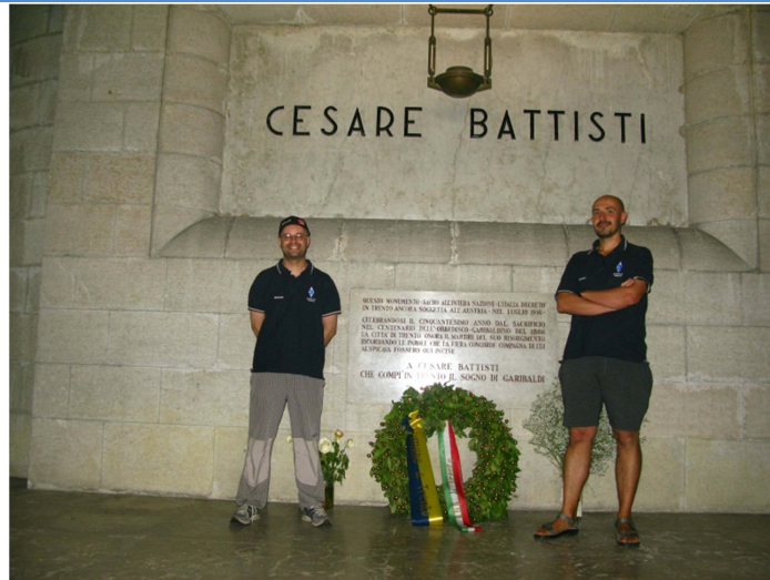
IN3ADW (a sinistra) e IN3HUU (a destra) all'interno del Mausoleo